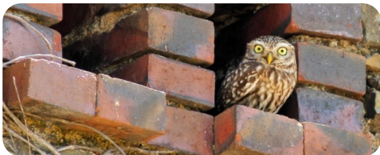
Chevêche d'Athéna © Sébastien You